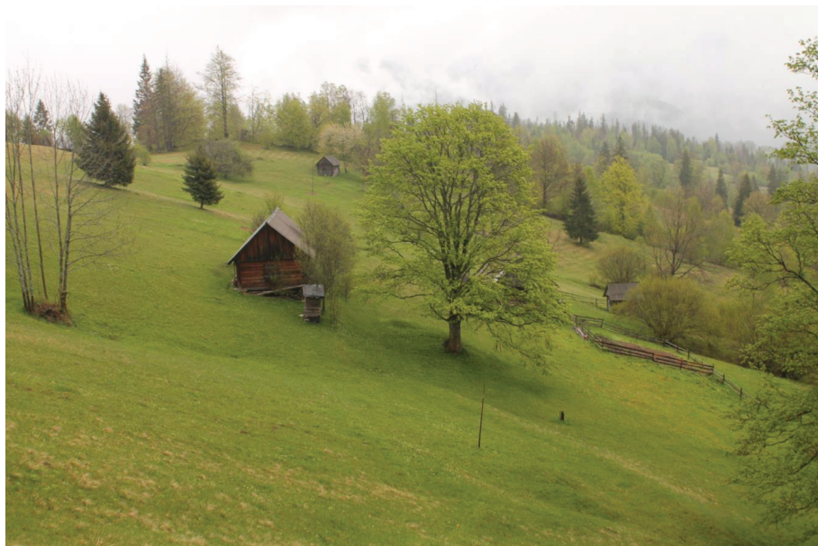
Fot. 2. Zespół zabudowy polaniarskiej na polanie stokowej. Widoczna chata sezonowa na horyzoncie izbica, zaś po prawej szopa typu fenil.

o małe okna, wycięte w jednej z belek zrębu, oraz asymetryczne wejście. Szopy budowane są najczęściej na polanach położonych na wysokościach od 600 do 1100 m n.p.m., oddalonych od 100 do 1500 metrów od centralnego zespołu polaniarskiego (jakim jest chata sezonowa), w pobliżu drogi i źródła wody.