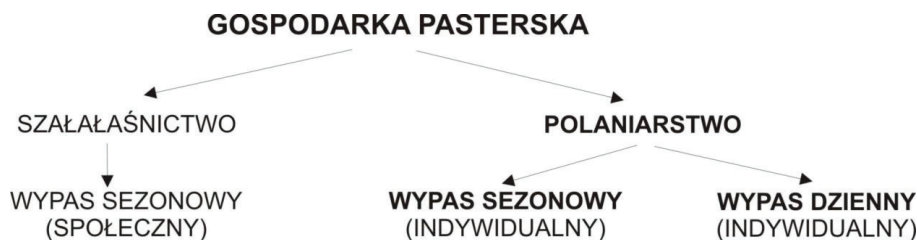
Ryc. 1. Typy gospodarki pasterskiej na obszarze Karpat polskich i ukraińskich pod koniec XX wieku.

ności od indywidualnej decyzji właściciela. W strukturze organizacji działań można było/można wyróżnić dwie formy gospodarowania, tj. wypas dzienny oraz wypas sezonowy (pośredni pomiędzy szalaśnictwem a polaniarstwem), charakteryzujący się kilkutygodniowym (od maja/czerwca do września) pobytom na polanie lub polanach tego samego właściciela (Ryc. 1).