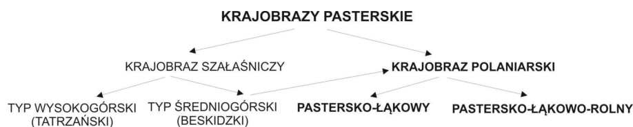
Ryc. 3. Typologia krajobrazów pasterskich na obszarze Karpat.

chaicznych działań gospodarczych w strefie polan górskich w paśmie Karpat Zewnętrznych polskich i ukraińskich. Pomimo zaistniałych zmian gospodarczych, społecznych i narodowościowych zachodzących w XX wieku, badania te ukazują, jak wiele nas łączy i jak dużo na płaszczyźnie etnogeograficznej jest jeszcze do zbadania.