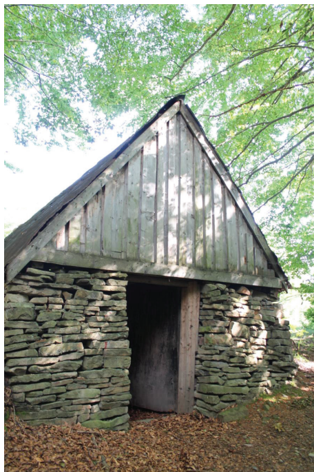
Fot. 1. Unikatowa konstrukcja kamiennej szopy w paśmie Kiczery – Beskid Mały.

regionu północnej Żywiecczyzny były szopy jednoizbowe z dachem dwuspadowym o konstrukcji krokwiowo-jętkowej, krytym gontem, darnicą lub blachą 15 . Dach osadzony był na ścianach z bali lub na kamiennych ścianach. Wejście do szopy, najczęściej wąskofrontowe, zamykane było drewnianymi drzwiami na kutyh zawiasach z metalową zasuwą lub metalowym skoblem. We wnętrzu znajdowało się klepisko i pniak służący jako stół, a na ścianach haki wykonane z gwoździ; sufit tworzyły trzy lub cztery belki służące do przechowywania siana na strychu. Cechą charakterystyczną budowli był brak okien oraz dymnika, co świadczyło o głównej funkcji użytkowania, jaką było magazynowanie siana 16 . Budynki tego regionu posiadały zbliżoną kubaturę 12 m 2 . Jej wyróżnikiem było pojedyncze występowanie na skraju śródleśnych polan stokowych na wysokości od 450 do 880 m n.p.m. Na podstawie przeprowadzonej analizy konstrukcyjno-architektonicznej wyróżniono trzy typy zabudowy polaniarskiej regionu Beskidu Małego: szopa kamienna (Fot. 1), szopa drewniano-kamienna oraz szopa drewniana 17 . Wszystkie szopy