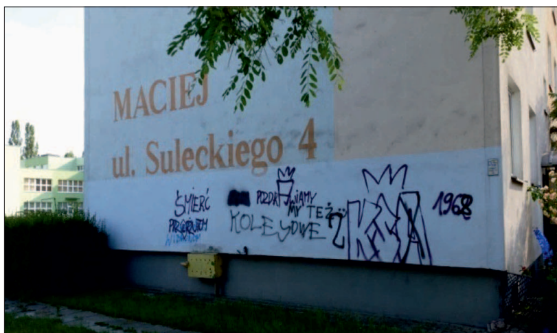
Rycina 2. „Kibolskie” graffiti Na Skarpie”

Każde uszkodzenie mienia jest dokumentowane i przekazywane do postępowania szkodowego z ubezpieczycielem nieruchomości. Graffiti, które zawierają wulgarne treści – obraźliwe, nazistowskie, antysemityczne lub nacjonalistyczne, są zamalowywane w pierwszej kolejności. Dotychczas ponowne pomalowanie elewacji było jedyną metodą zwalczania tego rodzaju zachowań antyspołecznych stosowaną przez omawiane Spółdzielnie Mieszkaniowe. Przynosiła ona jednak krótkofalowe rezultaty, ponieważ na jednolitej powierzchni w niedługim czasie pojawiają się kolejne graffiti. Zgodnie z koncepcją „wybitych szyb” każde uszkodzenie mienia powinno być jak najszybciej naprawiane lub usuwane. W miejscach, w których napisy na ścianach pozostawały nieusunięte, szybko obok pojawiały się następne (Rycina 2).