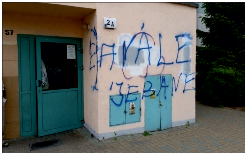
Rycina 3. „Kibolskie” graffiti „Na Skarpie”