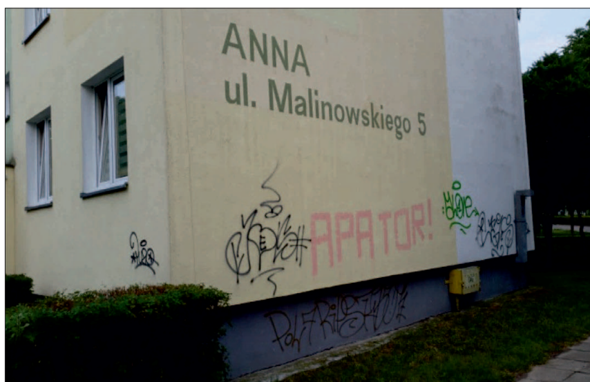
Rycina 4. „Kibolskie” graffiti Na Skarpie

Nowe graffiti o charakterze „kibolskim” oraz inne zniszczenia mienia, np. wybite szyby, powstają przede wszystkim w dniach, w których odbywają się mecze piłkarskie lub żużlowe w Toruniu. Wówczas „kibole” klubów sportowych grupują się i wspólnie dokonują zniszczeń mienia oraz rozbojów na terenie blokowisk we wschodniej części miasta Torunia.