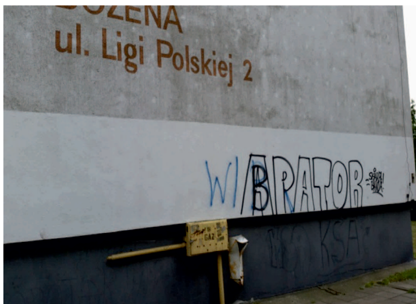
Rycina 5. „Kibolskie” graffiti „Na Skarpie”