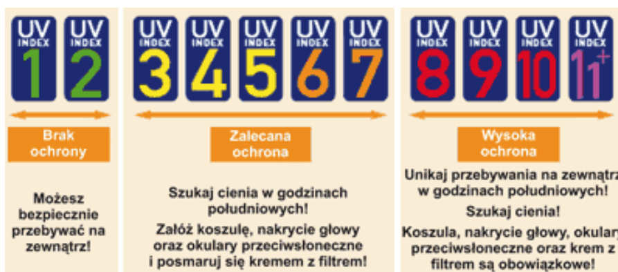
Rys. 2. Schemat zalecanej ochrony przed promieniowaniem UV w zależności od wartości Indeksu UV