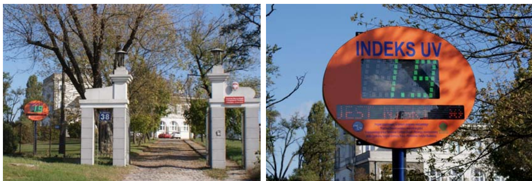
Rys. 3. System wyświetlania informacji o prognozie i bieżącej wartości Indeksu UV na wyświetlaczu LED zamontowany na terenie Ośrodka Aerologii IMGW - PIB w Legionowie

Informacje na tablicy LED są aktualizowane co minutę.