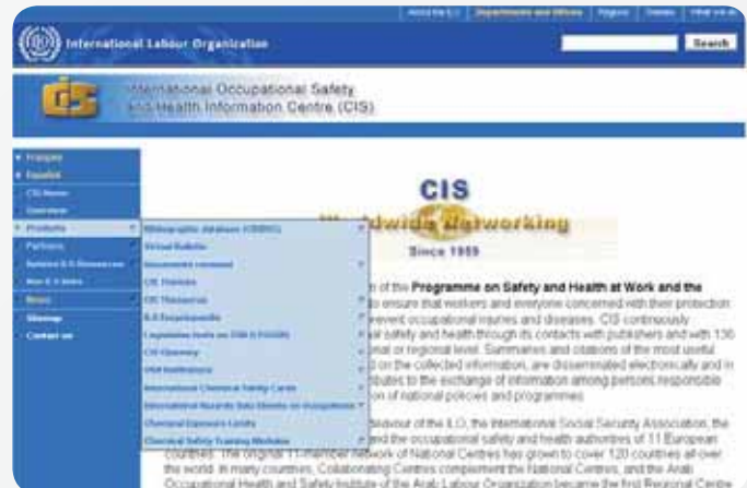
Rys. 2. Strona główna witryny Międzynarodowego Centrum CIS z wykazem produktów Fig. 2. Homepage of the International CIS Centre with a list of electronic products

Obecnie oprócz bazy CISDOC w witrynie są też udostępniane inne bazy danych opracowane przez CIS, a także międzynarodowe karty bezpieczeństwa chemicznego, karty zagrożeń w poszczególnych zawodach, wydawnictwa CIS, informacje o nowościach w ILO i w CIS, wykazy otrzymanych wydawnictw i innych źródeł informacji o bhp. Witryna ta zawiera także linki do wielu źródeł informacji [6]. Na rys. 2. przedstawiono stronę główną Międzynarodowego Centrum CIS z wykazem jego produktów.