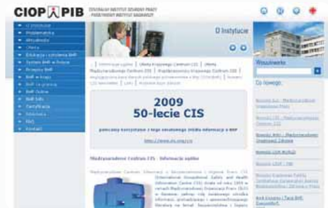
Rys. 3. Strona główna Polskiego Krajowego Centrum CIS

Na rys. 3. zamieszczono stronę główną witryny Polskiego Krajowego Centrum CIS, dostępną w ramach portalu CIOP-PIB.