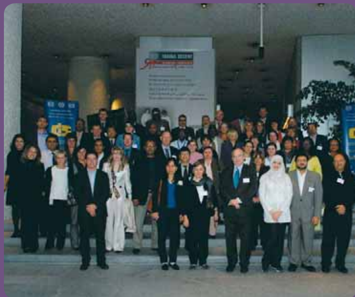
Uczestnicy Spotkania Centrów CIS w ILO, Genewa 2009

2009 saw the 90th anniversary of the International Labour Organization (ILO) as well as the 50th anniversary of the International Occupational Safety and Health Information Centre CIS and the network of CIS Centres, which form the international OSH information system CIS. This article discusses the setting up, beginnings and development of the CIS Centre in Geneva and of the whole network, its present achievements and products. The activities of the Polish National CIS Centre are described, too. The Central Institute for Labor Protection – National Research Institute (CIOP-PIB) has been the Polish National CIS Centre since 1960. The CIS information system is an important OSH information source. It provides Polish and international OSH specialists obtain the latest, reliable OSH information. It can also help in projects on providing workers' with safe working conditions and reducing occupational accidents and diseases.