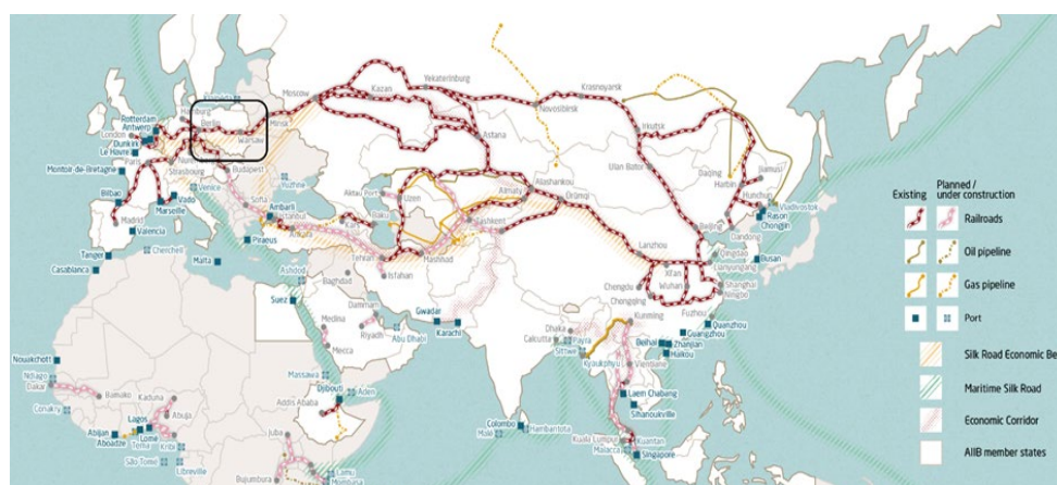
Rys. 1. Nowy Jedwabny Szlak (Mercator Institute for China Studies, 2015)

Oprócz polityki europejskiej wpływającej na znaczenie Polski w wymiarze logistyki międzynarodowej zidentyfikować można również czynniki zewnętrzne spoza kontynentu europejskiego. Jest to związane z ideą i rozwojem Nowego Jedwabnego Szlaku (Witkowski, Kurzątek, 2018; Kaczmarski, 2015). Nowy Jedwabny Szlak jest inicjatywą chińską, a jego celem jest tworzenie warunków do dalszego rozwoju, poszerzanie strefy wpływów, umacnianie chińskiej pozycji na arenie międzynarodowej, wzmacnianie współpracy gospodarczej pomiędzy państwami znajdującymi się w poszczególnych korytarzach szlaku. Zawiera on sieć dróg w ramach pasów lądowego i morskiego. Pas lądowy łączy Chiny z Azją Centralną i Europą, natomiast pas morski łączy Daleki Wschód z Bliskim Wschodem i Afryką. Pas lądowy związany jest z rozbudową i wzmocnieniem tras kolejowych, co powiązane jest m.in. z upowszechnieniem zakupów przez Internet. Celem jest skrócenie czasu transportu towarów między kontynentami do kilkunastu dni. Przez terytorium Polski przebiega jeden z korytarzy pasa lądowego Nowego Jedwabnego Szlaku (patrz rys. 1).