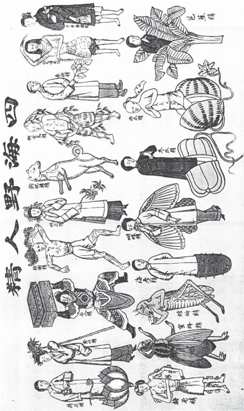
Dusze ludzkie w rozmaitych bytach: roślinach, zwierzętach i przedmiotach (za H. Doré, t. I, s. 137).