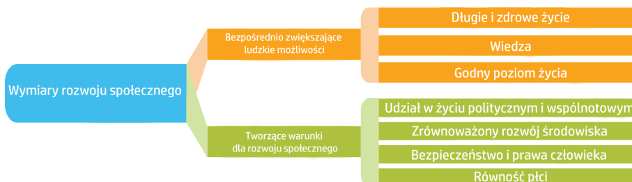
Rysunek 1. Wymiary rozwoju społecznego – schemat

Rozwój społeczny to pojęcie znacznie wykraczające poza zwykły rozwój ekonomiczny, mierzony tempem wzrostu PKB lub PKB per capita. W przeciwieństwie do niego, rozwój społeczny składa się z wielu wymiarów pozamaterialnych, które prowadzą do usprawnienia jakości życia i pomagają uwolnić drzemiący w ludziach potencjał (UNDP 2016). Wymiary te bezpośrednio zwiększają ludzkie możliwości, bądź stwarzają dogodne warunki do rozwoju jednostek. Na poniższym rysunku przedstawiono schemat tych wymiarów.