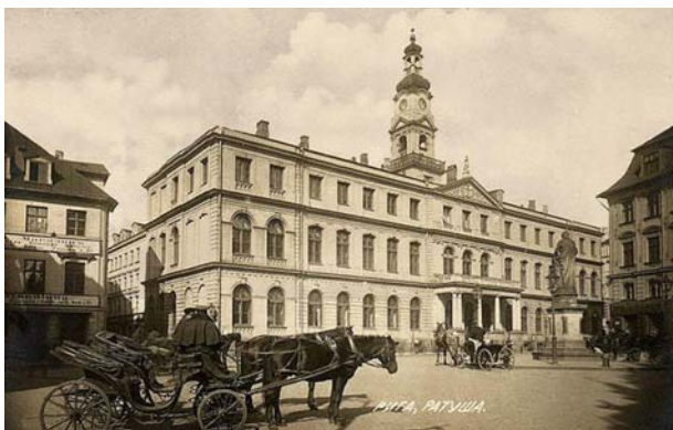
Ryc. 2. Ratusz, Ryga. Rekonstrukcja, zespół, 2001-2003 Fig. 2. Town hall, Riga. Reconstruction, team, 2001-2003