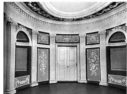
Ryc.18. Ryga, kamienica czynszowa: wnętrze, jadalnia. Architekt nieznan, 1787 Fig.18. Riga, tenement house: interior, dining room. Architect unknown, 1787