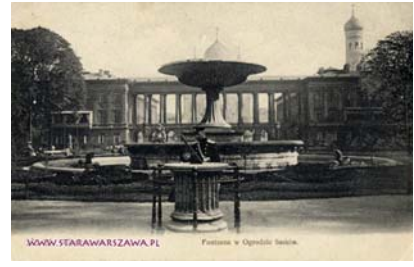
Ryc.15. Wielka fontanna w Orgodzie Saskim, Warszawa. H. Marconi, 1855 Fig.15. Great fountain in the Saski Garden, Warsaw. H. Marconi, 1855