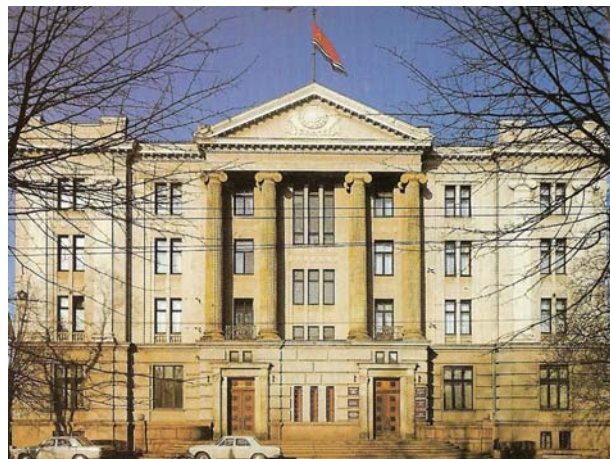
Ryc. 5. Siedziba MSZ, Ryga. A. Witte, 1913 Fig. 5. The seat of MSZ. Riga. A. Witte, 1913