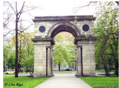
Ryc.17. Łuk Triumfalny, Ryga. J.D. Gottfried, 1817 Fig.17. Triumphal Arch, Riga. J.D. Gottfried, 1817