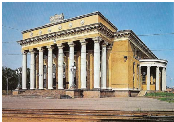
Ryc. 7. Dom Kultury i Techniki, Ryga. N. Semencovs, 1960 Fig. 7. House of Culture and Technology, Riga. N. Semencovs, 1960