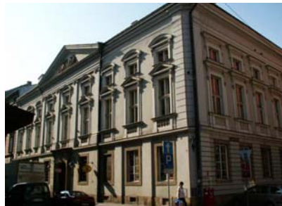
Ryc.13. Collegium Kołłątaja, Kraków. F. Radwański, 1787-1791 Fig.13. Collegium of Kołłątaj, Krakow. F. Radwański, 1787-1791