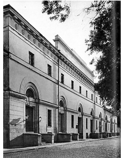
Ryc.16. Arsenal, Ryga. J.E. de Witte, 1790. Stan z 1980 Fig.16. Arsenal, Riga. J.E. de Witte, 1790. State from 1980