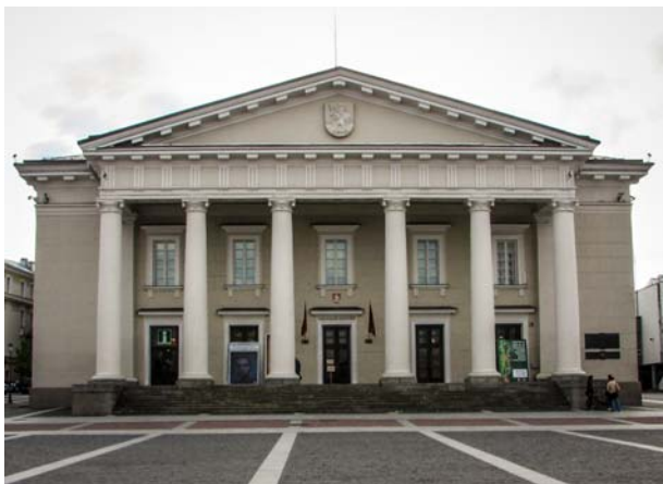
Ryc. 1. Ratusz, Wilno. W. Gucewicz, 1785-1799 Fig. 1. Town hall, Vilnius. W. Gucewicz, 1785-1799