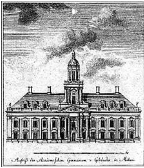
Ryc. 9. Academia Petrina, Mitawa. Proj. S. Jensen, 1773 Fig. 9. Academia Petrina, Mitawa. Proj. S. Jensen, 1773