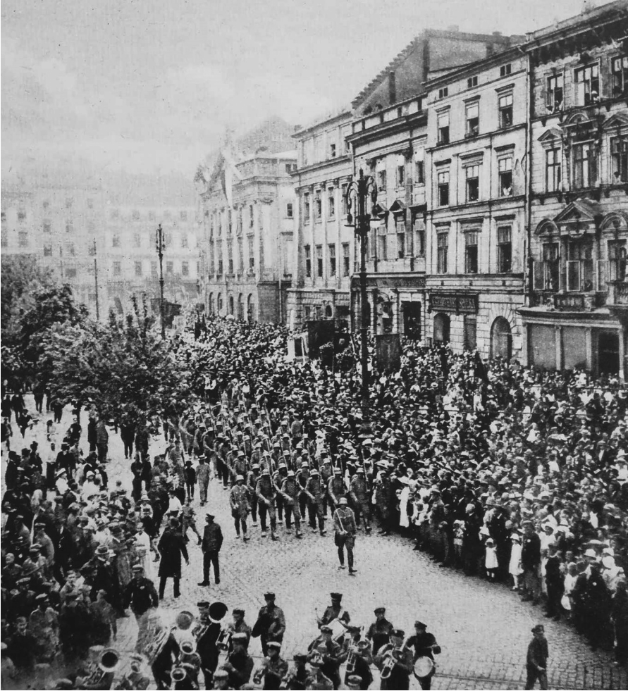
Fot. 7. Defilada oddziału piechoty polskiej na Rynku Głównym w Krakowie, 1919 r. Żołnierze umundurowani w mundury wz. 1917 oraz stalowe hełmy wzoru niemieckiego, co odpowiada wizerunkowi żołnierzy Szkoły Szturmowej znanemu ze szkiców ppor. Jana Steca