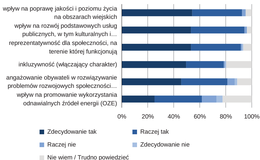
Ryc. 3. Rozkład odpowiedzi na pytanie określające cechy/właściwości LGD 10