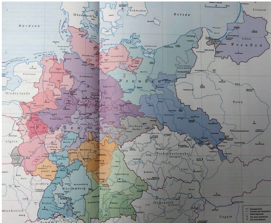
Mapa 2. Podział administracyjny Kościoła katolickiego w Niemczech w 1939 roku