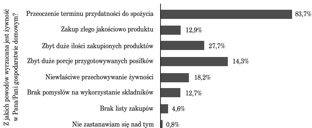
Rysunek 1. Powody wyrzucania żywności w gospodarstwie domowym