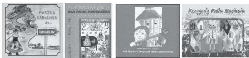
Rys. 5. Przykłady książek dla dzieci odnalezionych przez Federację Bibliotek Cyfrowych

Wśród dostawców wyszukiwanych zbiorów, czyli bibliotek, z których pochodzą dane zbiory, znalazły się m.in.: Chełmska Biblioteka Cyfrowa, Wielkopolska Biblioteka Cyfrowa i Mazowiecka Biblioteka Cyfrowa. Przejrzano strony poszczególnych bibliotek i w Mazowieckiej Bibliotece Cyfrowej odnaleziono całą kolekcję Literatura dla