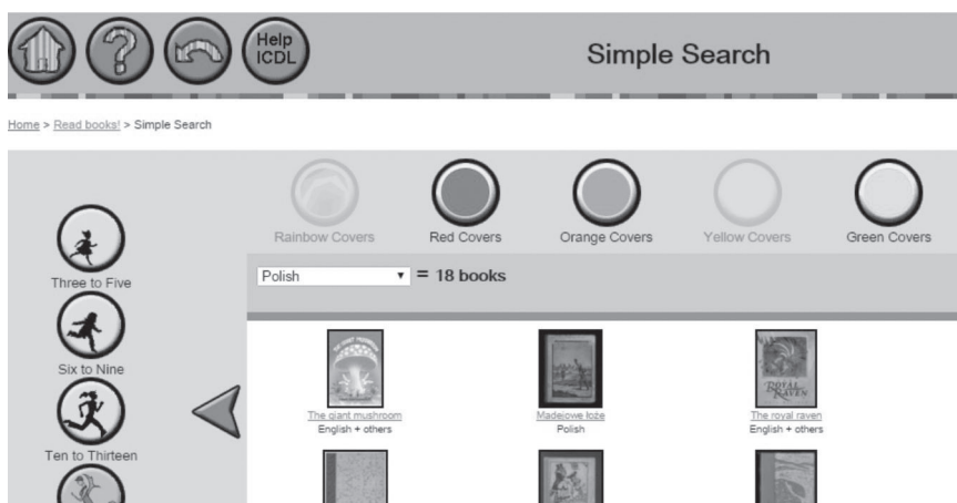
Rys. 1. Lista książek w języku polskim dostępnych w ICDL

Użytkownicy uzyskują dostęp do książek m.in. Marii Konopnickiej ( Filus, Miluś i Kizia : wesole kotki; Szczęśliwy świątek; Szkolne przygody Pimpusia Sadelko : wierszyki o kotkach ), Bronisławy Ostrowskiej