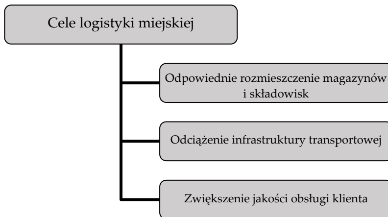
Rysunek 1. Cele logistyki miejskiej

Głównym przedmiotem analizy logistyki miejskiej jest przede wszystkim przepływ ludzi, materiałów oraz informacji w aglomeracjach miejskich. Wzrost znaczenia logistyki miejskiej jest związany ze wzrostem gęstości zaludnienia, dynamicznym rozwojem miast oraz rosnącą liczbą zakładów produkcyjnych oraz instytucji publicznych, co wymusza od władz miejskich przysposobienia i zastosowania odpowiednich zasad zarządzania logistycznego. Projektując takie rozwiązania w mieście, należy dysponować wiedzą na temat zachowań logistycznych podmiotów gospodarczych 3 . Rysunek 1 przedstawia główne cele logistyki miejskiej.