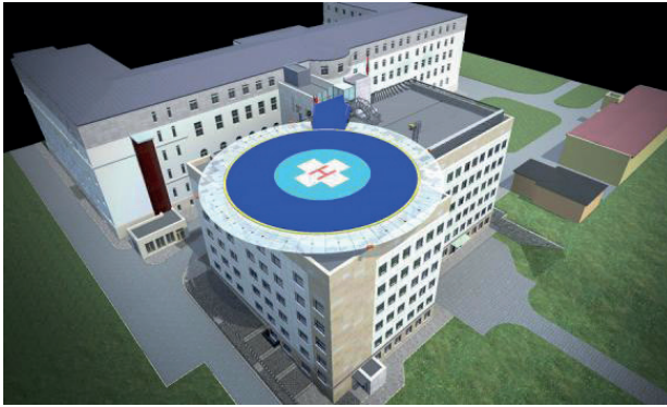
Rysunek 1. Wizualizacja projektu rozbudowy szpitala [23]. FIGURE 1. Visualization of the project

Dnia 29 lipca 2016 roku decyzją Ministra Obrony Narodowej wprowadzono odznakę pamiątkową i rozpoznawczą Szpitala. Miała ona na celu popularyzowanie i podtrzymywanie tradycji służb medycznych oraz wyróżnienie zasług na rzecz Szpitala. „Odznaka wykonana jest w kształcie krzyża maltańskiego, ułożonego na wieńcu laurowo-dębowym. Ramiona są barwy wiśniowej ze złotym obrzeżem. Centralnie na krzyżu umieszczona jest owalna tarcza barwy granatowej z wizerunkiem srebrzystej laski Eskulapa. U podstawy wieńca znajduje się granatowa szarfa, na której umieszczona jest cyfra „1” oraz litery „WSzKzP” – skrót nazwy szpitala. Barwy nawiązują do historycznych barw służby zdrowia, a symbole do wykonywanych zadań oraz miejsca stacjonowania” [24]. Nadanie odznaki jest wyrazem uznania wieloletniej roli, jaką szpital pełnił zarówno dla wojskowej służby medycznej, jak i Lublina oraz wschodniej części Polski.