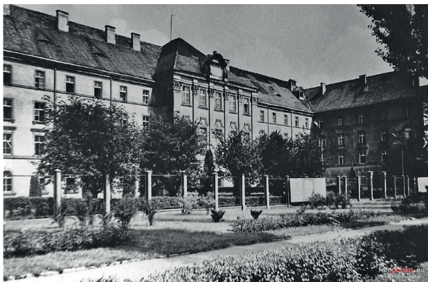
Zdjęcie 3. Szpital w okresie 1948-1954 [12]. PICTURE 3. Hospital over the period 1948-1954