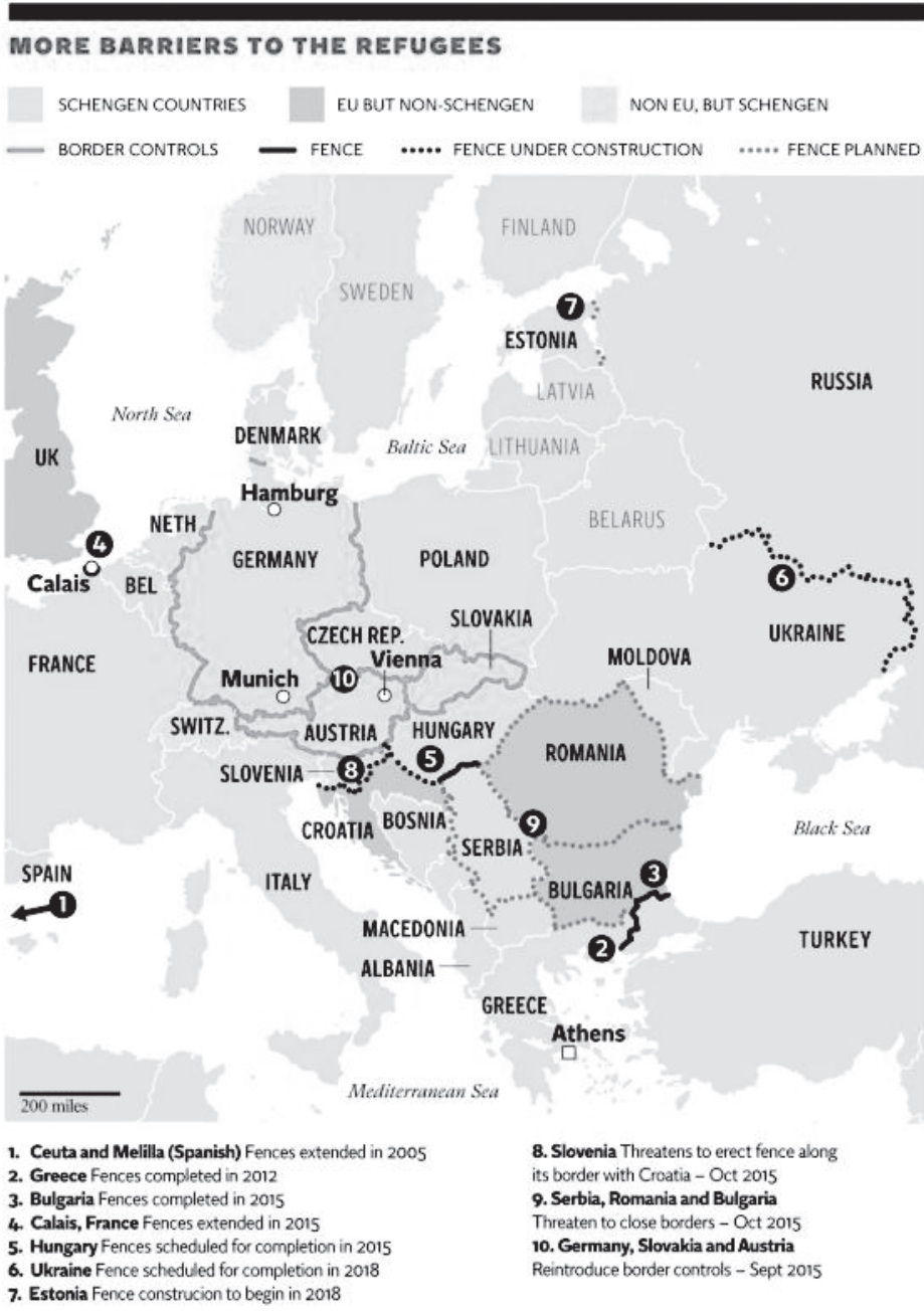
Rys. 2. Budowa barier dla uchodźców