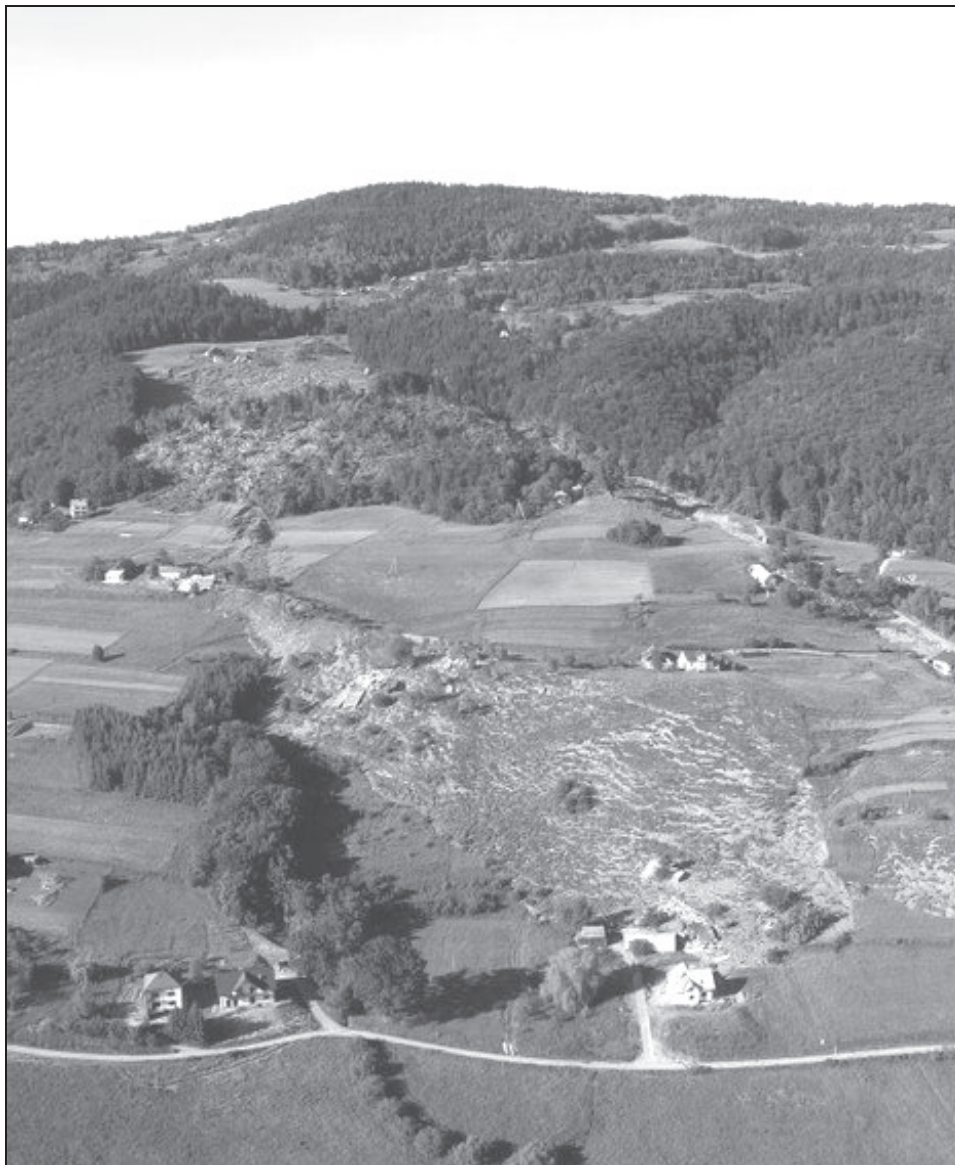
Rysunek 1. Osuwisko w Kłodnem (gmina Limanowa) [ www.limanowa.in ] Figure 1. Landslide in Kłodno (community Limanowa)

straty, kiedy to w wyniku opadów o charakterze nawałny (np. w Muszynie 07.07 spadło w 40 min 51,3mm/m 2 , a 14.07 w 30 min – 54mm/m 2 ) ziemia spływała ze stoków, zasypując, bądź niszcząc budynki [Monitoring osuwisk...].