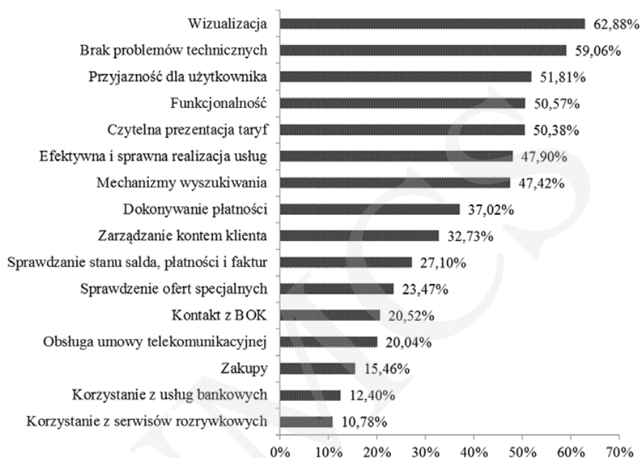
Rys. 2. Uśrednione oceny kryteriów jakości serwisów operatorów telekomunikacyjnych