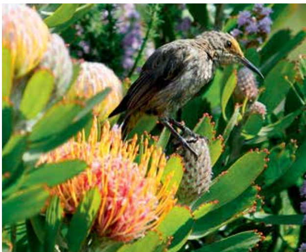
Ryc 7. Dudkowiec kafryjski ( Promerops cafer ) na młodym kwiatostanie Proteaceae .

Dość podobny mechanizm, różniący się tym, że pyłek pobierany jest nie z pylników a szyjki słupka, występuje u Isopogon anethifolius . W pączku, kwiat ma podobną budowę do Persoonia . Różnica polega na tym, że pylniki otwierają się jeszcze w pączku,