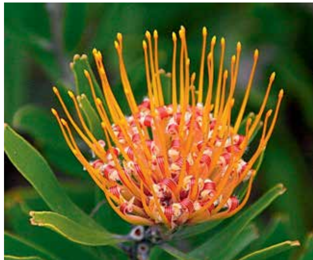
Ryc 8. Kulisty kwiatostan Leucospermum sp. Widoczne zrośnięte działki kielicha i wygięte szyjki słupka. Pręciki i znamiona schowane w białowłosionym „kapturku”.

U Symphyonema i Conospermum występuje jeszcze inny model zapylania przez owady. W drobnych, żółtych kwiatkach Symphyonema pylniki są ciasno ustawione wokół szyjki słupka. Gdy pylniki dojrzewają, segmenty okwiatu odchylają się w dół