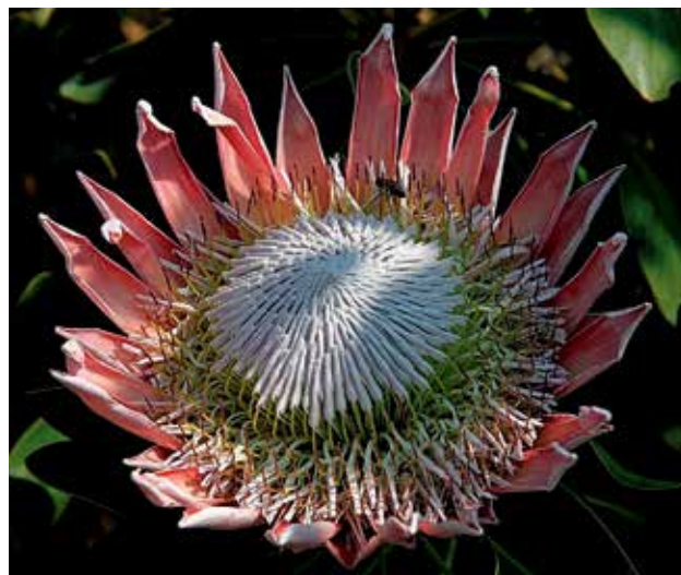
Ryc 6. Stadia rozwoju kwiatostanu Protea cynaroides . Kwiatostan w pełni otwarty. Brzeżne kwiaty w pełni otwarte – widoczne znamiona słupków (brunatne); środkowe kwiaty we wcześniejszym stadium – widoczne białe „kapturki” kryjące znamiona słupków i pylniki. Szyjki słupków pętelkowato wygięte.

też barwa niebieska i fioletowa. Fioletowe kwiaty są u Banksia hookeriana i Grevillea bracteosa (tu szyjki słupka są niebieskie) oraz w rodzaju Hicksbeachia . Kwiaty w kolorze jasnyniebiesko-fioletowym są u Protea nana .