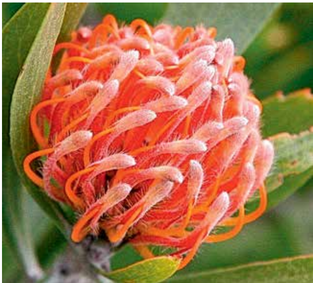
Ryc 9. Kwiatostan Leucospermum gerrardii . Kwiaty w pełnym rozkwicie; widoczne słupki. Zrośnięte działki kielicha odgięte do tyłu. Czerwone paski to miejsce zrośnięcia poszczególnych działek.

Owady, głównie dwuskrzydłe oraz chrząszcze, zapylają też niektóre gatunki Protea .