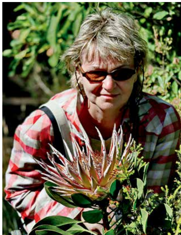
Ryc 2. Kwiatostan Protea cynaroides . Zestawienie z osobą przedstawia jego wielkość.

Korona jest zredukowana i przekształcona w krążek miodnikowy. U różnych rodzajów Proteaceae redukcja korony jest wyrażona w różnym stopniu. W rodzaju Franklandia są jeszcze zachowane pewne cechy korony – jest wykształcona zrosłopłatkowa korona z czterema łatkami, ale funkcjonują one jako nektarniki.