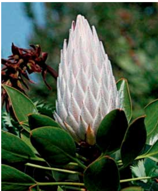
Ryc 3. Stadia rozwoju kwiatostanu Protea cynaroides . Młody kwiatostan otoczony białowłosionymi podsadkami.

Słupkowie – słupek 1, górny, utworzony z 1 owocolistka; szyjka nitkowata, prosta lub zgięta, ze skośnym lub bocznym znamieniem, którego czynna powierzchnia może być ograniczona do niewielkiego punktu na szczycie szyjki lub w centrum szczytowego dysku (rozszerzona, szczytowa część szyjki słupka). Zalążnia jest jednokomorowa z licznymi zalążkami. Niekiedy ich liczba jest mniejsza (nawet 1–2). U licznych Proteaceae posiadających szczytkową koronę – zalążnia jest na trzonku (gynofor). Jest to charakterystyczne dla gatunków ornitogamicznych. Obok cech świadczących o wysokiej specjalizacji w budowie słupka, są też cechy pierwotne – nie całkowite zrośnięcie się brzegów owocolistka i obecność na nich włosków gruczołowych (u większości podrodziny Grevilleoideae ).