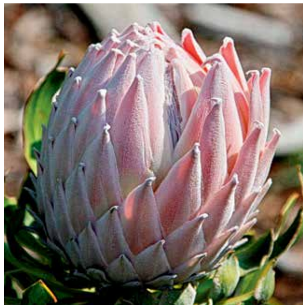
Ryc 4. Stadia rozwoju kwiatostanu Protea cynaroides . Rozwijający się kwiatostan. Podsadki zabarwiają się. Widoczne zróżnicowanie ich wielkości – od małych u podstawy – do dużych ku szczytowi okrywy kwiatostanu.

średnica osiąga 30 cm (Ryc. 2). Niezależnie od siebie u różnych przedstawicieli Proteaceae rysuje się tendencja do tworzenia głowiastych kwiatostanów, zewnętrznie przypominających koszyczki złożonych. Natomiast 2-kwiatowe kwiatostany w podrodzynie Grevilleoideae uważane są za silnie zredukowane wiechy.