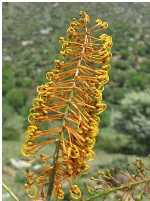
Ryc 10. Kwiatostan Grevillea robusta .

Ornitogamia u Proteaceae jest szczególnie często spotykana w Australii. Liczne gatunki Grevillea , Banksia , niektóre gatunki Dryandra , Adenanthos , Hakea i Lambertia są zapylane przez miodojady. Także nowozelandzka Knithia excelsa jest zapylana przez ptaki. Papuga – lorysa górską ( Trichoglossus