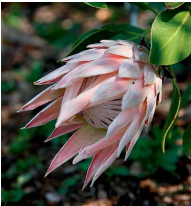
Ryc 5. Stadia rozwoju kwiatostanu Protea cynaroides . W środku rozchylających się podsadek widoczne kwiaty.

są ciasno ustawione skrętoległe. Okrywają one młody kwiatostan i sprawiają wrażenie łusek pączka, tym bardziej, że u niektórych gatunków ich dolna (zewnątrzna) strona jest gęsto pokryta jedwabistymi włoskami (Ryc. 3). W rozwiniętym kwiatostanie często pełnią rolę powabni, gdyż najwyższe stojące podsadki (np. u Protea i Leucadendron ) są barwne i znacznie większe od dolnych (Ryc. 4–6). Mogą posiadać barwną obwódkę lub kępkę barwnych włosków na szczycie. Natomiast w czasie owocowania znów pełnią rolę ochronną, okrywając dojrzewające owoce. Górne i najniższe podsadki mogą się różnić nie tylko wielkością, ale i kształtem.