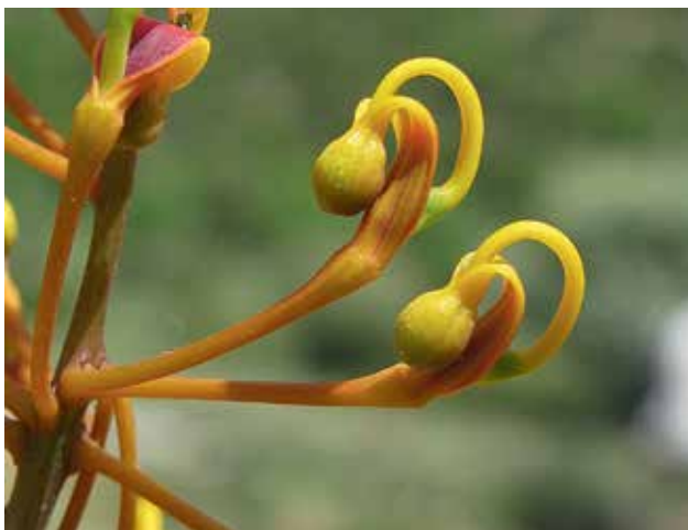
Ryc 11. Kwiaty Grevillea robusta . Widoczne zielone zalążnie i pętlikowate szyjki słupka. Znamię i pręciki ukryte w kulistym „kapturku”.

Przystosowanie kwiatostanów Proteaceae i zapylających ptaków w niektórych przypadkach ma formę wzajemnej zależności. Dudkowiec kafryjski jest endemicznym gatunkiem w zachodniej i wschodniej części Kraju Przylądkowego i związany jest z formacją fynbos (odpowiednik chapparal) i występującymi tam gatunkami Protea . Związek jest tak ścisły, że dudkowiec całe życie przebywa w sąsiedztwie krzewiastych gatunków Protea , które zapyla. Gniazdo często buduje na krzewie Protea z jego podsadek i owocostanów, z uwięzionymi w nich nasionami. W ten sposób również przyczynia się do rozsiewania nasion.