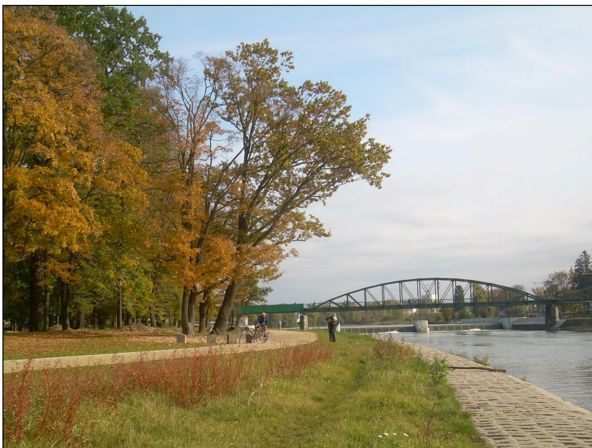
Fot. 3. Wyspa Pasięka. Park Nadodrzański, w tle most na Wyspę Bolko, 2010.

Photo 2. Bolko Island. Zoological Garden, 2015.