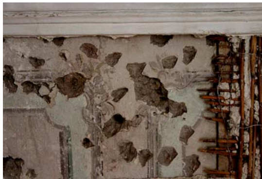
Fig. 3. Column Hall, surviving polychrome artwork panel.

Ryc.2.Sala Kolumnowa, widoczna usunięta wyprawa tynkarska w dolnej płycinie.