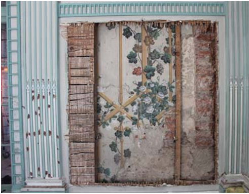
Fig. 6. Verandah Room, visible preserved polychrome in the room.

was rebuilt by Bauqué in accordance with the English designs fashionable at the time. The movable room furnishings were often changed, as can be seen in archival photographs.