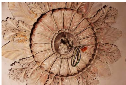
Fig. 4. Column Hall, Stucco Rosette after the removal of the layers of paint.

of Warsaw has not yet been confirmed. It is known, however, that the display of the fabric in the Column Hall was not its original destination, that it was most likely one of the sides of a screen. This is indicated both by its size and the reverence with which it was made. At present, in the room there is an exact copy of the fabric, created with modern printing methods.