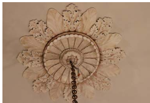
Fig. 5. Column Hall, Stucco Rosette after being restored to its original color.

Ryc.4. Sala Kolumnowa, sztukateryjna rozeta po usunięciu wtórnych warstw malarskich.