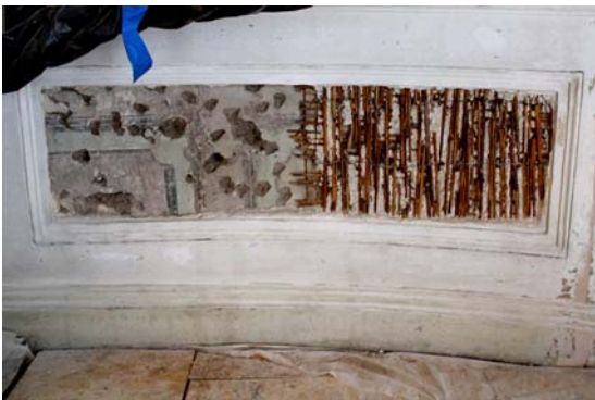
Fig. 2. Column Hall, visible artwork after the plaster has been removed from the lower panel.

Prior to the commencement of the conservation work in 2014, a number of studies including stratigraphic-exploratory, laboratory and architectural studies were conducted. Both research and conservation works were performed by the teams at Art Forum Bożena Boba-Dyga and Konserwacja Zabytków Sabina Szkodlarska, and the leader of this work was Paulina Łyziak-Dyga. The aforementioned studies have confirmed the various phases of the reconstruction of the room. In the lower parts of the room illusionistically polychrome panels with a vegetal motif from the period from 1610-1640, showing the original purpose of the room. These decorations have survived as relics the western, northern and southern walls, with the exception of the panels between the curved arches located at the junction of the north and south walls to the east wall. The architectural discoveries that have been made have shown the construction of arches consists of a boarded framework on which reeds are installed with a thick layer of lime plaster.