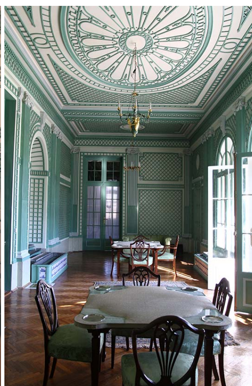
Fig. 9. Veranda Room after conservation work has been carried out.

Ryc.8. Pokój Werandowy, widoczna zachowana polichromia z blendą maskującą.