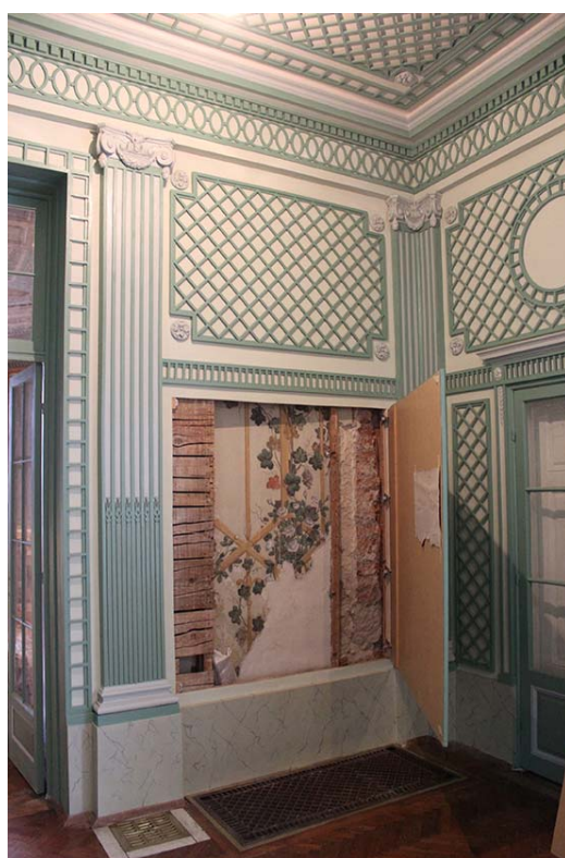
Fig. 8. Veranda Room, visible preserved polychrome with blend cover.

The present decor of the Verandah Room reflects its appearance when the last entailer left the Castle.