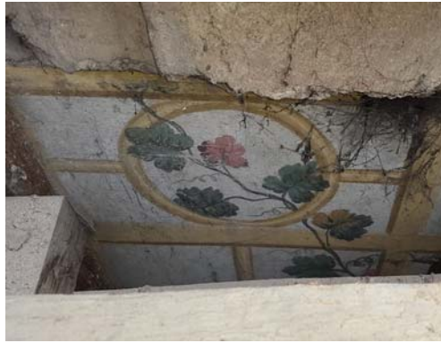
Fig. 7. Verandah Room, visible preserved polychrome at roof level.

Ryc. 6. Pokój Werandowy, widoczna zachowana polichromia w pomieszczeniu.