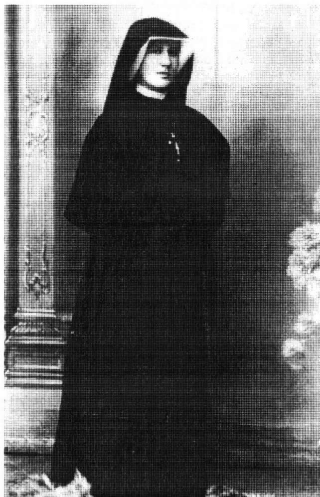
Bł. s. Maria Faustyna Kowalska /1905-1938/, Apostolka Bożego Miłosierdzia.