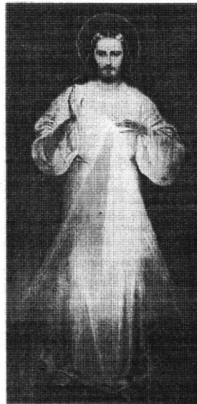
Jezu, ufam Tobie!